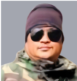
दयाल हाइ राई स्थानीयबासी

खोटाङको दिक्तेलमा आयोजित बृहत् निःशुल्क स्वास्थ्य शिविर धेरै स्थानीयका लागि केवल उपचार सेवा मात्र थिएन, त्यो आशा, राहत र आत्मीयताको अनुभव पनि थियो। गाउँमै विशेषज्ञ चिकित्सकको सेवा पाउनु अधिकांश स्थानीयका लागि पहिलो अवसर बनेको थियो। विशेषगरी आर्थिक अवस्था कमजोर भएका तथा नियमित उपचारबाट वञ्चित नागरिकका लागि यो कार्यक्रम जीवनमै सम्भन लायक अनुभव बन्यो।